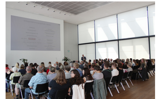
Der Schlaganfalltag lockt viele Besucher in den Bürgersaal.